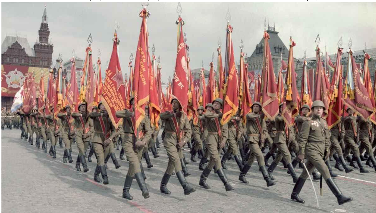
Парад Победы 1945г.

Изначально планировалось, что парад состоится, как и всегда, 9 мая. Но глобальный форс-мажор под названием "коронавирус" вынудил скорректировать планы. Парад Победы в 2020 году прошел 24 июня – ровно в тот самый день, когда 75 лет назад состоялся самый первый торжественный марш армии народа-освободителя, победившего фашистскую Германию. Тем не менее, именно в нынешний юбилей, эта своеобразная историческая проекция выглядит символической.